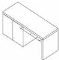
Indien L=600mm of groter dan is ondersteuning noodzakelijk.

Zie voor ondersteuningssets hoofdstuk1 van ons verkoopboek. Pag. 1.1-9.